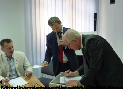
Pracownicy Rządowi i Pracownicy Rządowi