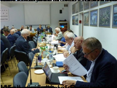
Pracownicy Rządowi i Pracownicy Rządowi