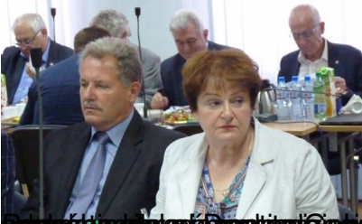
Pracownicy Rządowi i Pracownicy Rządowi