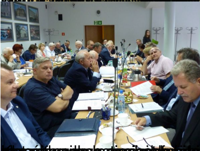
Pracownicy Rządowi i Pracownicy Rządowi