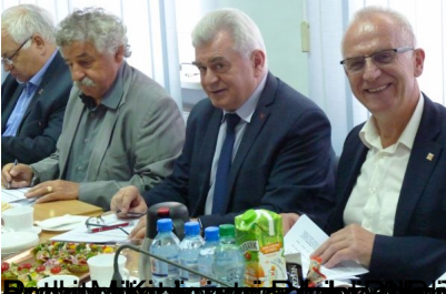
Pracownicy Rządowi i Pracownicy Rządowi